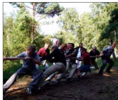
Vem vinner dragkampen?