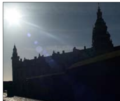
Skattjakt på Kronborg