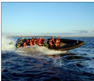
RIB-båten ger en äkta fartkänsla!