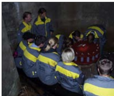
Lukt & Smak