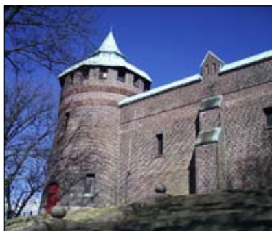
Spännande aktiviteter på Borgen