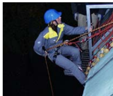
Fira ner er från höga höjder